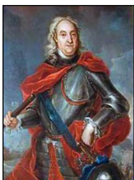
Ф. М. Апраксин

Командующий гребным флотом Ф. М. Апраксин отмечал: «Воистину нельзя описать мужества российских войск...» . Было захвачено 10 шведских кораблей. Враг потерял убитыми — 361 чел., 350 — ранеными. В плен было взято 237 человек. Потери русских составили 124 человека убитыми и 342 — ранеными.