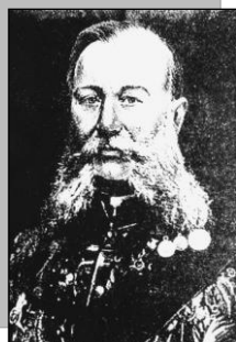
А.А. Зубов, губернатор Саратовской области

Основателем музейного дела в Саратове можно с уверенностью считать Преподобного Иакова (Вечеркова), Епископа Саратовского и Царицынского и как отмечал один из первых его библиографов публицист Ф.В. Духовников, «он должен занять самое видное и почётное место в истории просвещения Саратовского края»