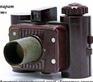
Историко-краеведческий музей «Хранитель времени» ГБУ СОДО «ОЦЭКИТ»