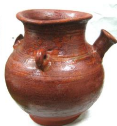
Историко-краеведческий музей «Хранитель времени» ГБУ СОДО «ОЦЭКИТ» РУКОМОЙНИК 1-я пол. XX века.